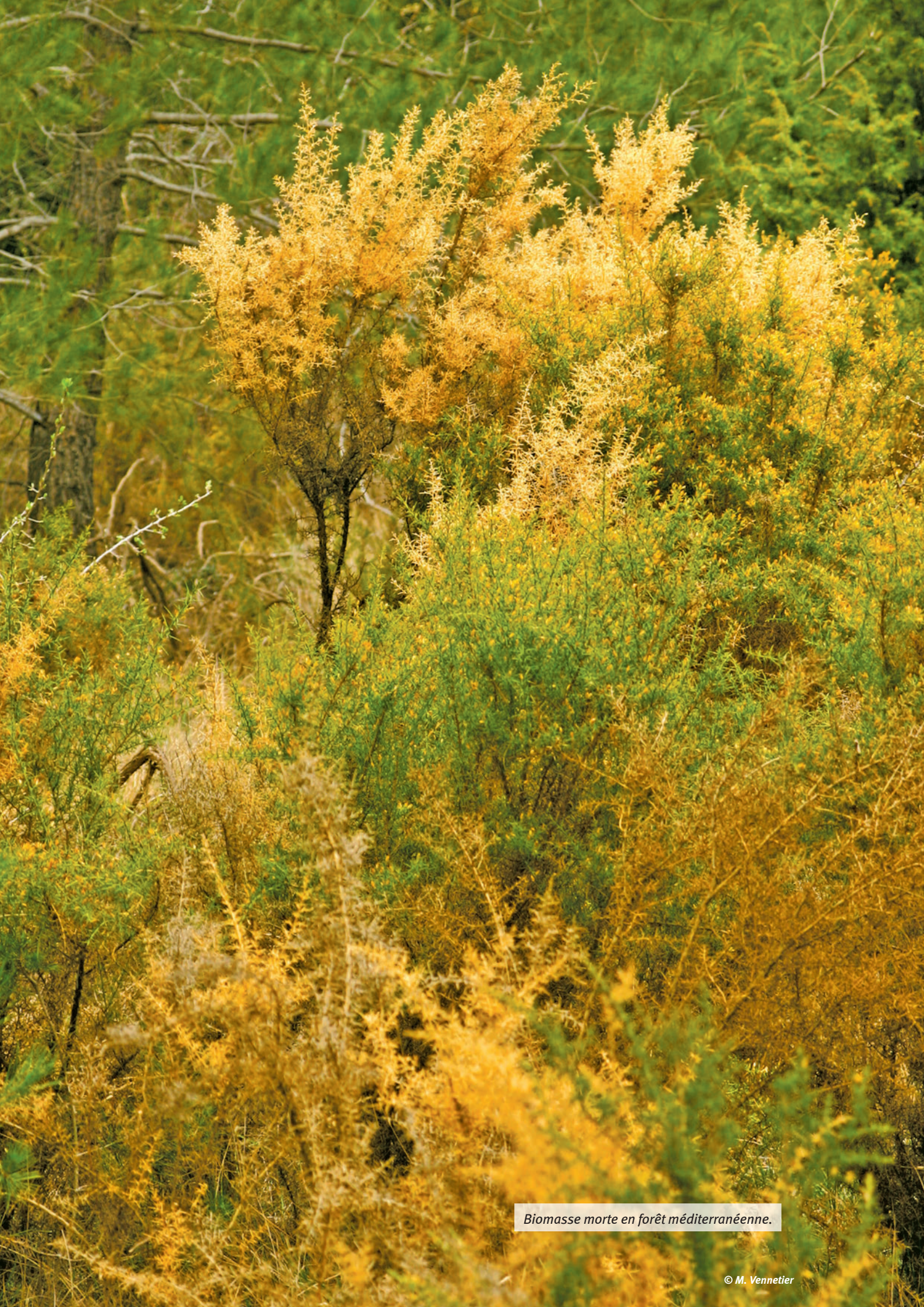
Biomasse morte en forêt méditerranéenne.