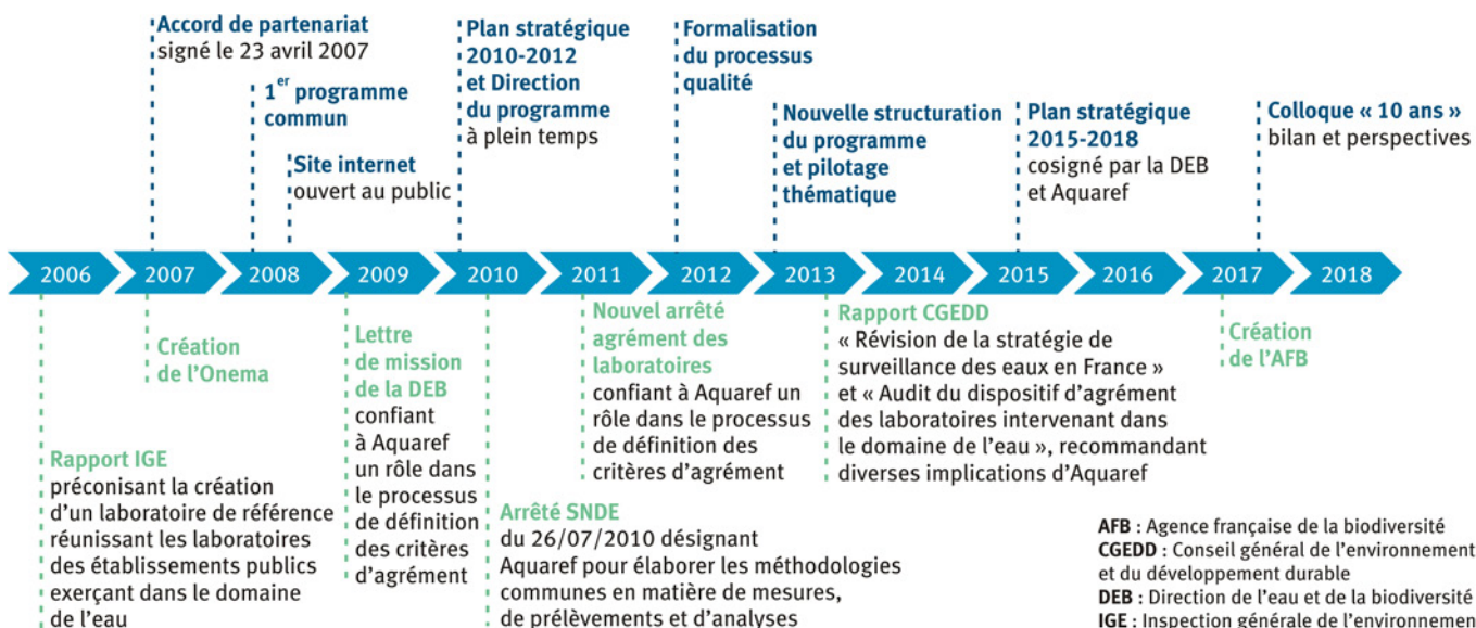
1 Les étapes-clés du programme Aquaref (texte en bleu) et de la mise en œuvre du schéma national des données sur l'eau (texte en vert).