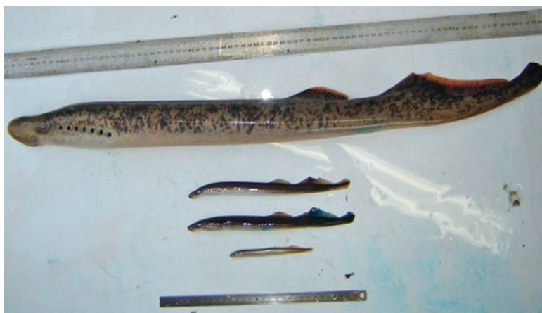
Photo 1 – Photographie des trois espèces de lamproie présentes en France. De haut en bas : lamproie marine, lamproie de rivière (x2) et lamproie de Planer.

1. Les écotypes sont des groupes de populations d'une même espèce qui présentent des adaptations distinctes en réponse aux conditions environnementales spécifiques de leur habitat.